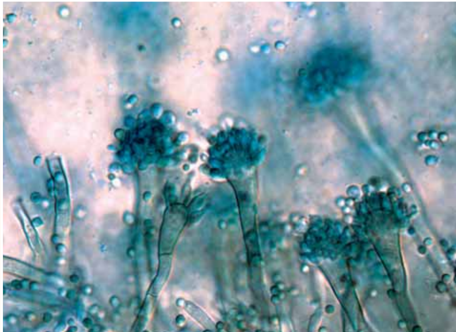
Schimmel unter dem Mikroskop

Im Landesvorstand ist er bereits seit 1994. NRW stellt den größten Landesverband im Deutschen Mieterbund. Hier sind 53 Mietervereine zusammengeschlossen, die rund 330.000 Mieterhaushalte vertreten.